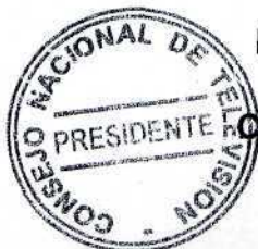
HERMAN CHADWICK PIÑERA Presidente Subrogante Consejo Nacional de Televisión

ANOTESE, TOMESE RAZON, NOTIFIQUESE AL INTERESADO Y A LA SUBSECRETARIA DE TELECOMUNICACIONES.