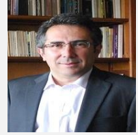
Director of School of Journalism and Mass Communication; Helen Firstbrook Franklin Professor of Journalism, Universidad de Wisconsin-Madison

Junto con relevar los retos de entornos comunicativos que representen a la sociedad en su conjunto, también insistió en que para lograr esto, no podemos pensar solamente en los gobiernos y en las plataformas, sino también en los ciudadanos y en la autorregulación.