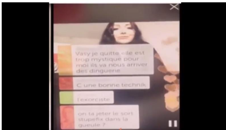
Se suicida mientras transmit a en vivo en periscope joven francesa