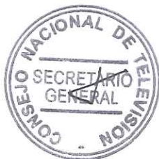
HERMAN CHADWICK PIÑERA Presidente Consejo Nacional de Televisión

ANOTESE, TOMESE RAZON, NOTIFIQUESE AL INTERESADO Y A LA SUBSECRETARIA DE TELECOMUNICACIONES.