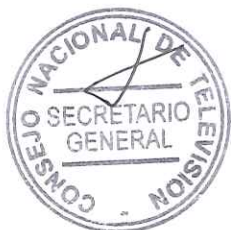
HERMAN CHADWICK PIÑERA Presidente Consejo Nacional de Televisión

ANOTESE, TOMESE RAZON, NOTIFIQUESE AL INTERESADO Y A LA SUBSECRETARIA DE TELECOMUNICACIONES.