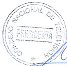
Catalina Parot Donoso CATALINA PAROT DONOSO Presidenta Consejo Nacional de Televisión

ANÓTESE, NOTIFÍQUESE AL INTERESADO Y A LA SUBSECRETARÍA DE TELECOMUNICACIONES.