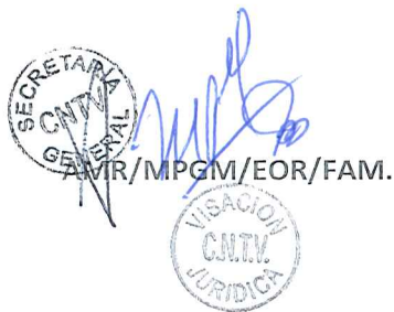
CATALINA PAROT DONOSO Presidenta Consejo Nacional de Televisión