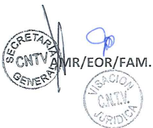
CATALINA PAROT DONOSO Presidenta Consejo Nacional de Televisión